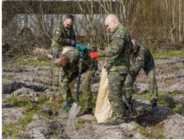
funkcjonariusze z Warmińsko-Mazurskiego Oddziału Straży Granicznej sadzą las