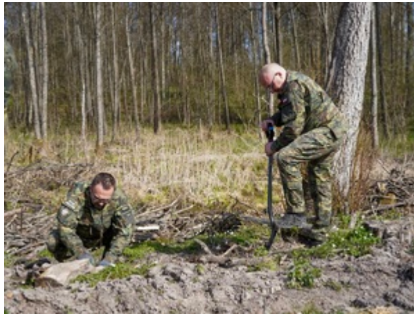
funkcjonariusze z Warmińsko-Mazurskiego Oddziału Straży Granicznej podczas sadzenia lasu