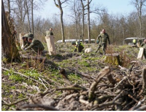
funkcjonariusze z Warmińsko-Mazurskiego Oddziału Straży Granicznej podczas sadzenia lasu