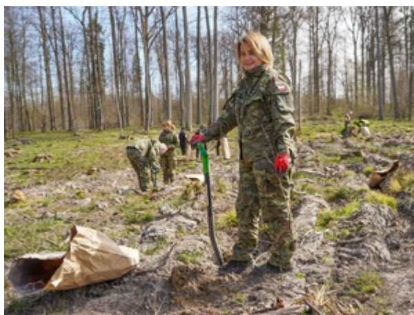
funkcjonariuszka z Warmińsko-Mazurskiego Oddziału Straży Granicznej podczas sadzenia lasu