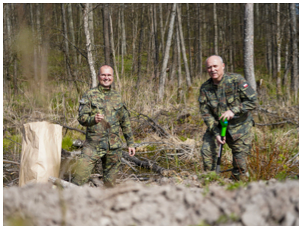
funkcjonariusze z Warmińsko-Mazurskiego Oddziału Straży Granicznej podczas sadzenia lasu