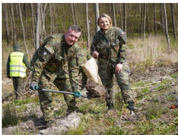
funkcjonariusze z Warmińsko-Mazurskiego Oddziału Straży Granicznej podczas sadzenia lasu