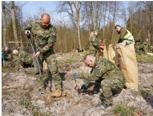
Zastępca Komendanta Warmińsko-Mazurskiego Oddziału Straży Granicznej płk SG Rafał Grzejszczak wraz z