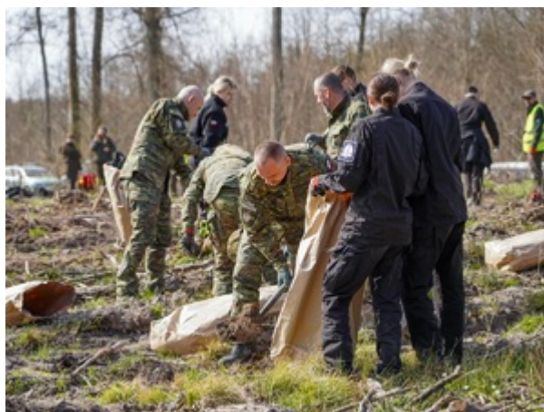
funkcjonariusze z Warmińsko-Mazurskiego Oddziału Straży Granicznej z młodzieżą podczas sadzenia lasu