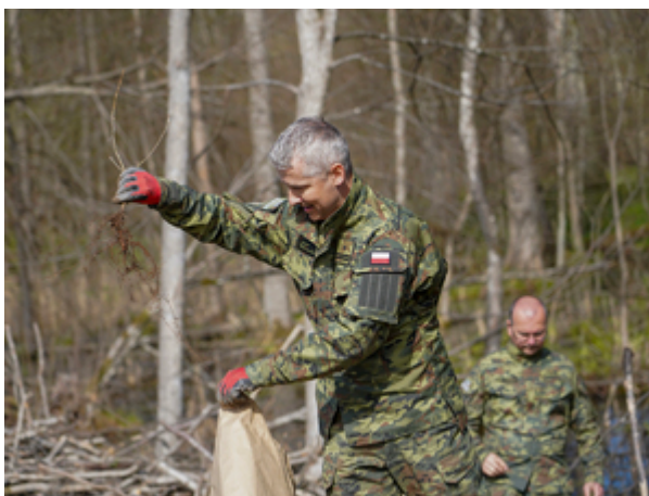
funkcjonariusz z Warmińsko-Mazurskiego Oddziału Straży Granicznej podczas sadzenia lasu