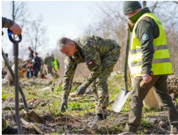
funkcjonariusz z Warmińsko-Mazurskiego Oddziału Straży Granicznej z przedstawicielem Lasów Państwowych sadzą dęby