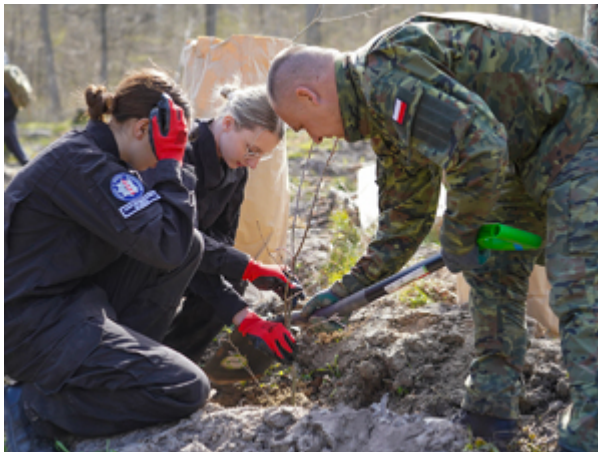
młodzież podczas sadzenia drzew w Wilczym Szańcu w Gierłozy