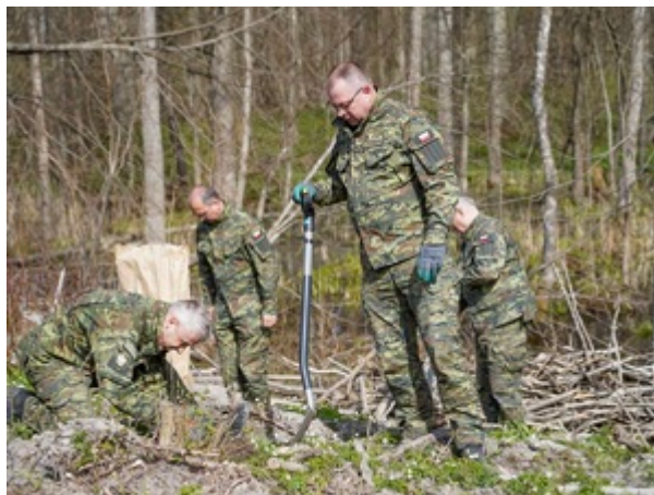
funkcjonariusze z Warmińsko-Mazurskiego Oddziału Straży Granicznej podczas sadzenia lasu