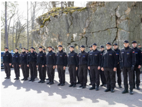
uczniowie Liceum Ogólnokształcącego ZDZ w Białymstoku z siedzibą w Giżycku