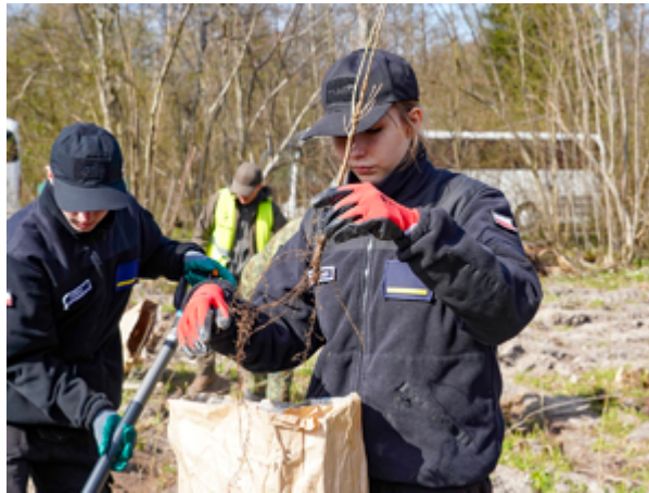
młodzież podczas sadzenia drzew w Wilczym Szańcu w Gierłozy