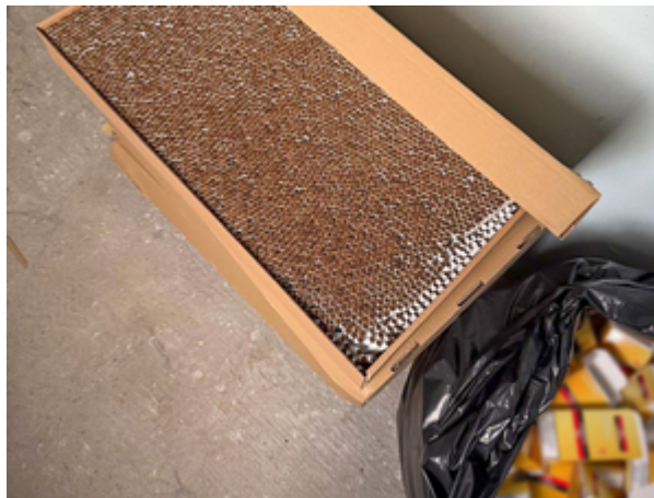
ujawnione nielegalne papierosy