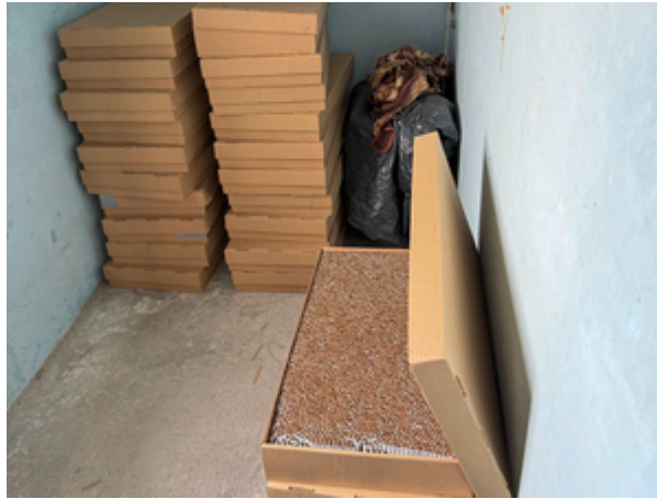
ujawnione nielegalne papierosy