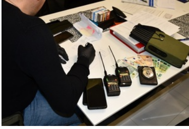
zdeponowane środki pieniężne