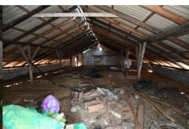
ujawnione nielegalne wyroby tytoniowe