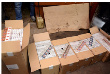
ujawnione nielegalne wyroby tytoniowe

Za udział w zorganizowanej grupie przestępczej grozi im do 5 lat pozbawienia wolności, a za produkcję i handel lewymi papierosami wysoka kara grzywny.