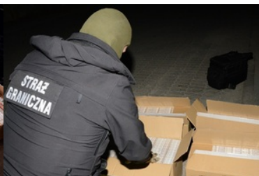
ujawnione nielegalne wyroby tytoniowe