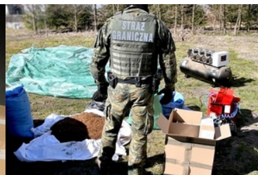
ujawnione nielegalne wyroby tytoniowe