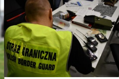
zdeponowane środki pieniężne