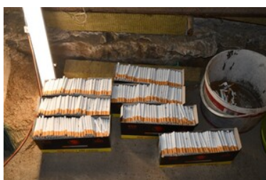
ujawnione nielegalne wyroby tytoniowe