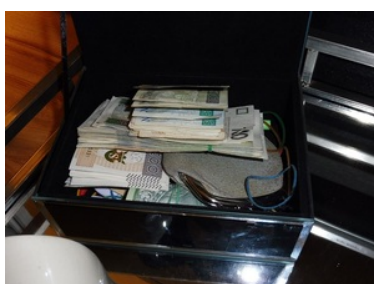
ujawnione nielegalne wyroby tytoniowe