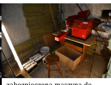
zabezpieczona maszyna do produkcji "lewych papierosów"