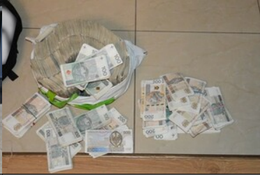
zabezpieczone środki finansowe