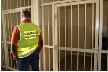
Rozbita zorganizowana grupa przestępcza