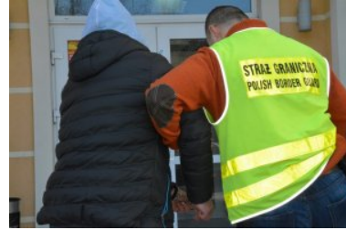
Rozbita zorganizowana grupa przestępcza