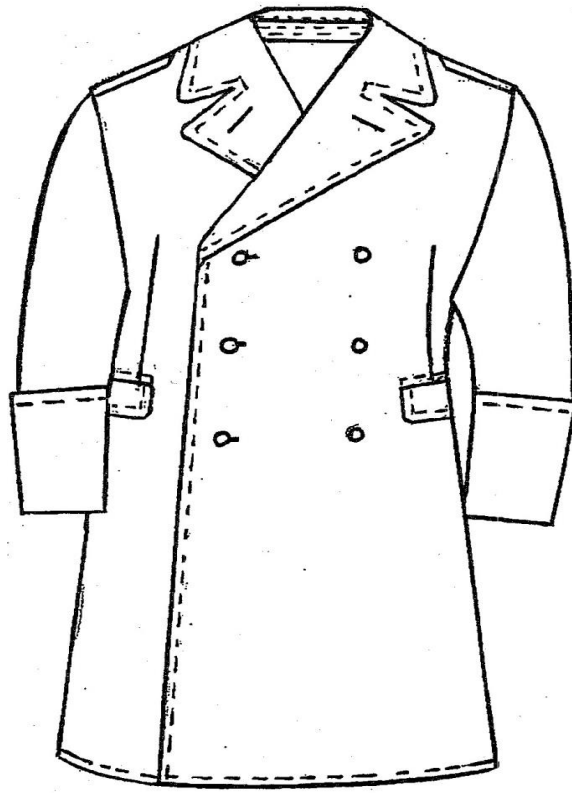
Rysunek 1 - Płaszcz sukienny (typu wojskowego) – widok z przodu