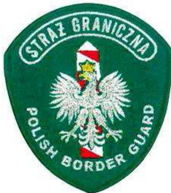
Rysunek 3 - Emblemat „Straż Graniczna Polish Border Guard”