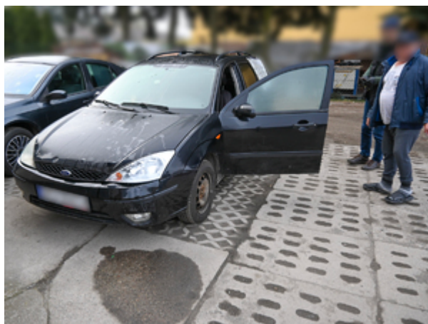
zatrzymany obywatel Mołdawii