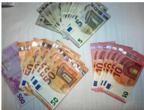
ujawnione banknoty euro