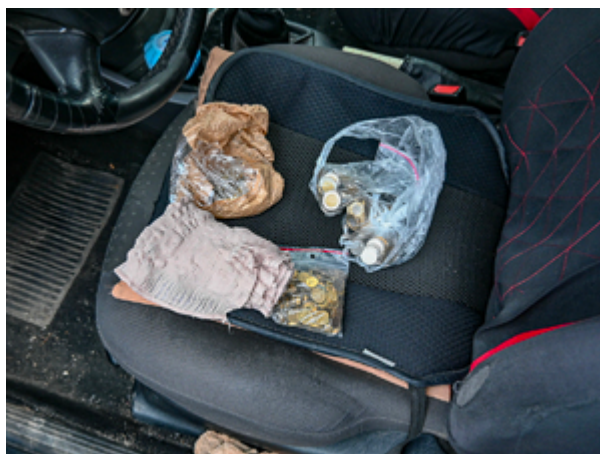
ujawnione środki pieniężne