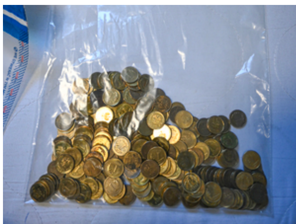
ujawnione środki pieniężne