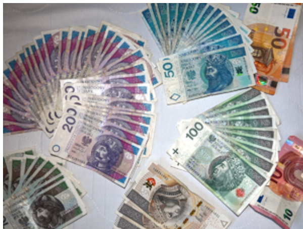
ujawnione środki finansowe