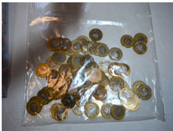
ujawnione środki pieniężne