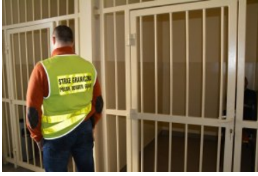
Rozbita zorganizowana grupa przestępcza