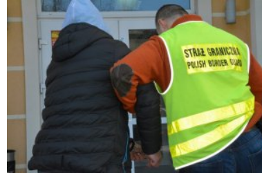
Rozbita zorganizowana grupa przestępcza