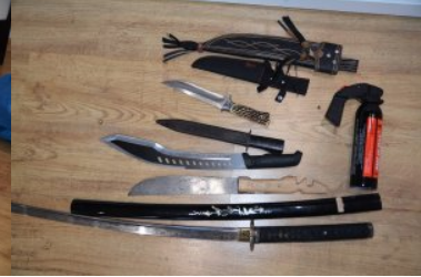
Zabezpieczone niebezpieczne przedmioty