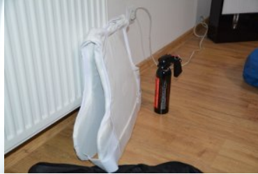
Zabezpieczone niebezpieczne przedmioty