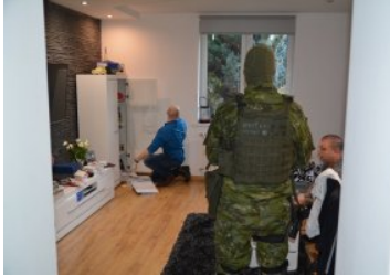
Rozbita zorganizowana grupa przestępcza